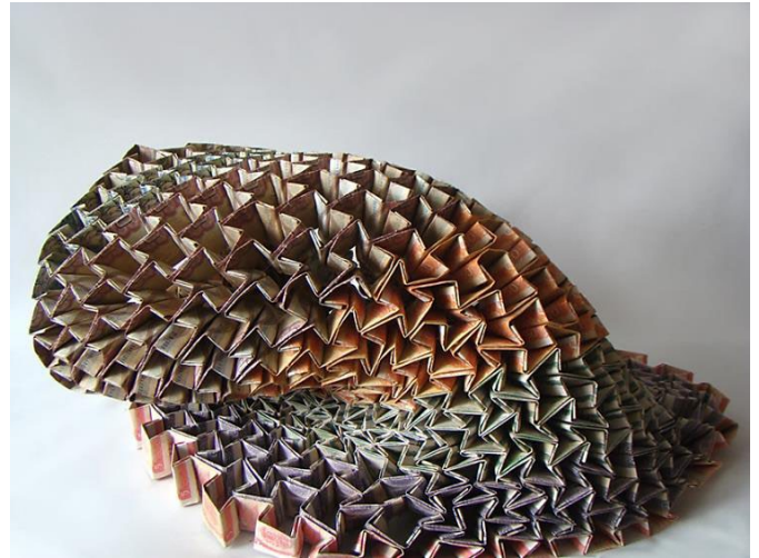
Imagen 1. Caída Libre (2014), Isabel Cisneros. Ensamblaje Billetes, monedas, pegamento, termofusible, guaya de acero y balines de plata, 150 x 63 cm. (Cortesía de la artista).

En este sentido, los tejidos, acumulaciones y ensamblajes realizados por la artista nos conducen por una abstracción geométrica que concreta la universalidad de las formas geométricas cotidianas desapercibidas y que muestran su coherencia en obras como Caída libre (2014) (Imagen 1), compuesta por la plegadura de billetes ya en desuso dentro del cono monetario venezolano, y que para sostener su frágil peso llevan por dentro monedas, igualmente en inútiles. Geometrías que ocultan, de forma discreta, en estos intencionados materiales