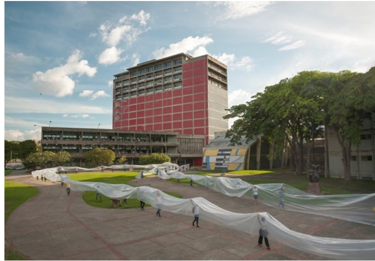
Imagen 3. Construir el mar (2015), Miguel Braceli. Intervención participativa, UCV Caracas-Venezuela. (Cortesía del artista).

De allí, que el trabajo de Braceli contemple diversos y heterogéneos espacios y participaciones dentro de lo que el mismo ha concebido como Proyecto Colectivo , que desdibuja la contemplación del movimiento con la intención de integrarlo a