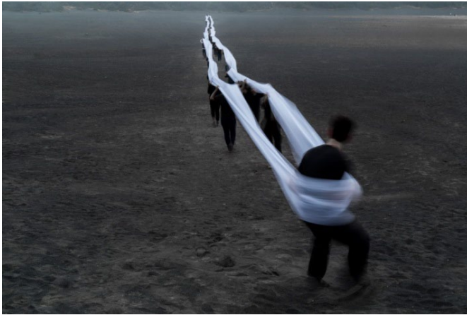
Imagen 4. Irazú (2016), Miguel Braceli. Intervención participativa. Cordillera Volcánica Central, Costa Rica.