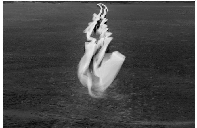
Imagen 5. Irazú (2016), Miguel Braceli. Intervención participativa. Cordillera Volcánica Central, Costa Rica.

De allí, que la abstracción geométrica venezolana sea continuamente retomada, pues en ella es factible la formulación de otros trayectos de la realidad, como los que realiza la artista venezolana Érika Ordosgoitti (Caracas, 1980- ), quien toma diversos campos abstracto-geométricos por asalto, con la intención de trastocarlos en medio de la estrategia apropiativa de la subtitulación.